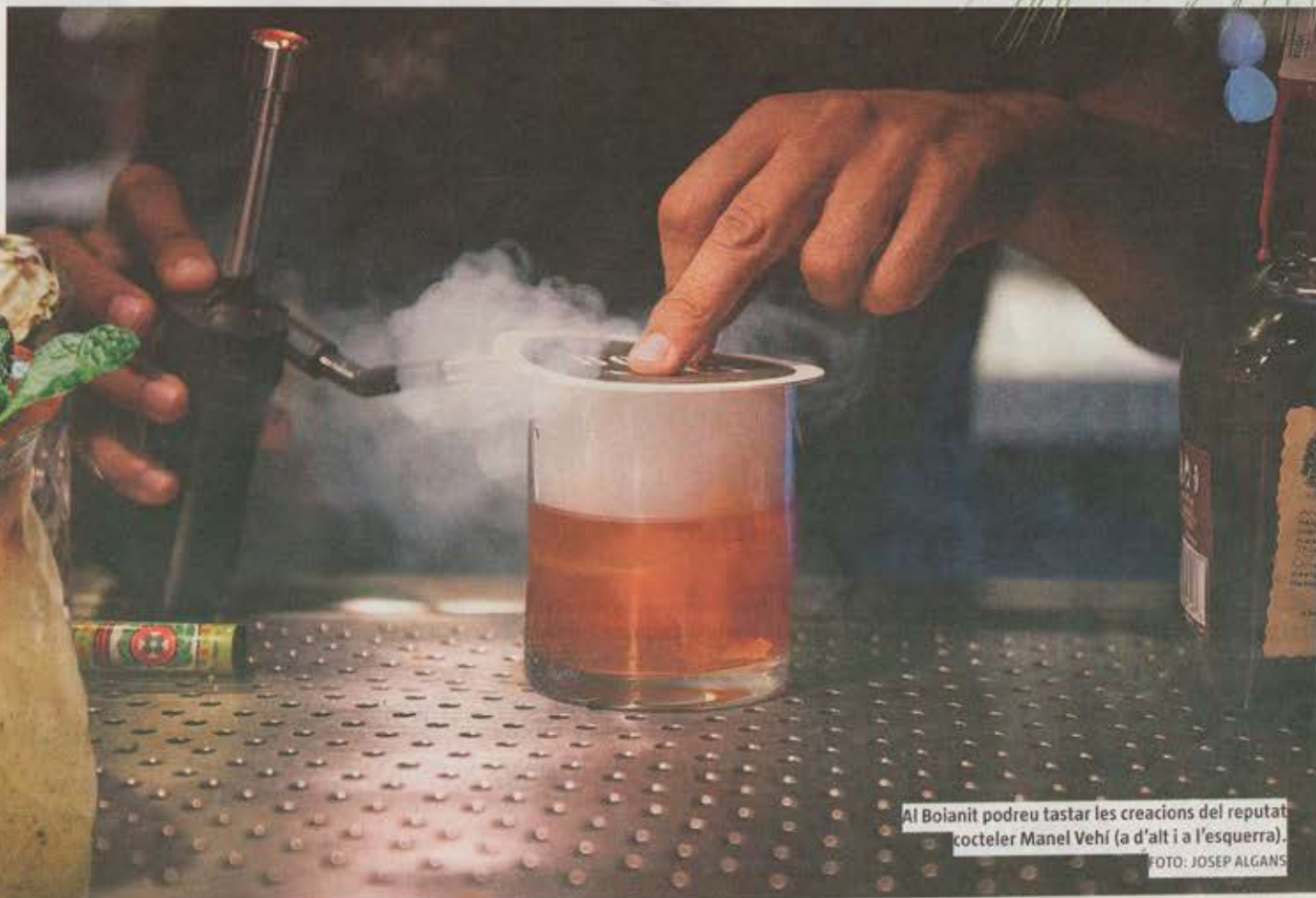
Al Boianit podreu tastar les creacions del reputat cocteler Manel Vehí (a d'alt i a l'esquerra).